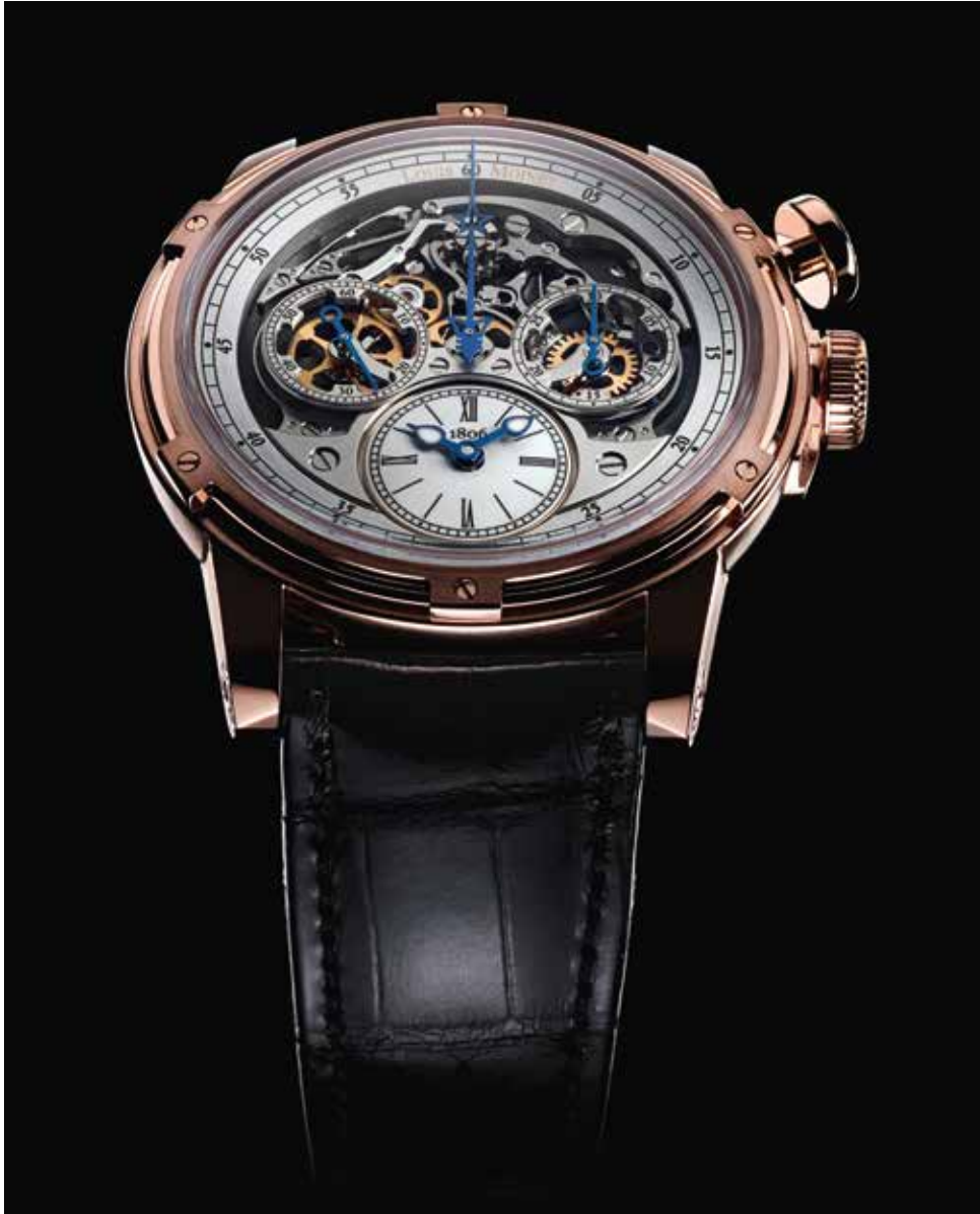
Chronographe Memoris, Ateliers Louis Moinet, 2015.